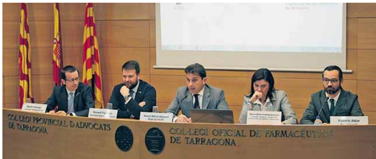
Taula presidencial de la I Jornada sobre Dret de l'Esport.