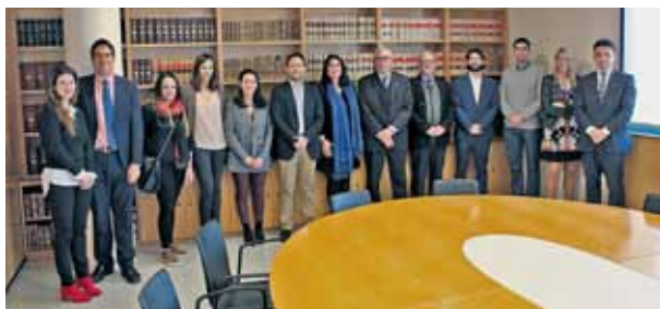
Acte celebrat el dia 15 de febrer de 2019.

Durant el primer semestre de 2019 s'han celebrat dos actes de benvinguda en els que han participat vint nous col·legiats.