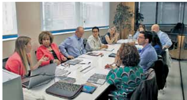
Taula de treball celebrada el dia 17 de maig.