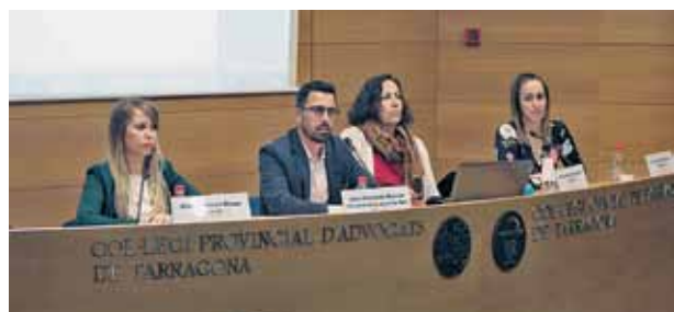
Membres de la Secció de Dret Animal de l'ICAT.