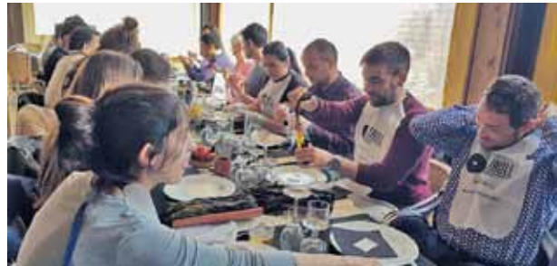
Assistents a la calçotada organitzada pel GAJT.

El passat dissabte 16 de març va tenir lloc la trobada de Joves Advocats de Catalunya a la seu de l'ICAT. Membres de diferents agrupacions de joves advocats i advocades d'arreu del nostre territori es van trobar a Tarragona en una jornada de treball i també de lleure, ja que finalitzada l'assemblea general ordinària va tenir lloc la tradicional calçotada al restaurant El Trull, en la que també van assistir companys i companyes de Tarragona.