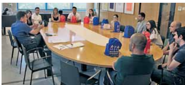
Acte celebrat el dia 6 de juliol de 2019.