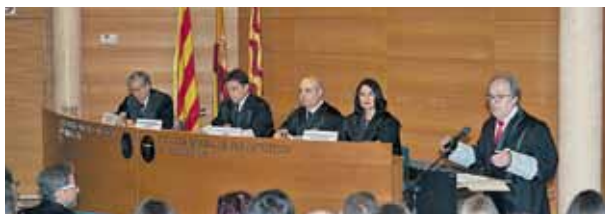
El president del Consell de l'Advocacia, Ignasi Puig.