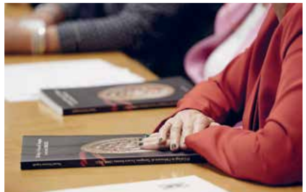
Llibre d'història de l'ICAT