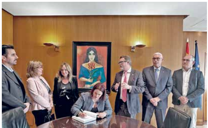
Visita institucional de representants de l'ICAT a la Subdelegació del Govern