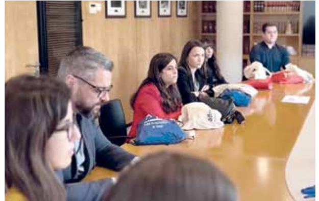
Representants del GAJT durant l'acte de benvinguda