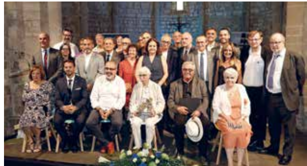
Foto de grup dels homenatjats amb els membres de les comissions de llengua catalana del CICAC