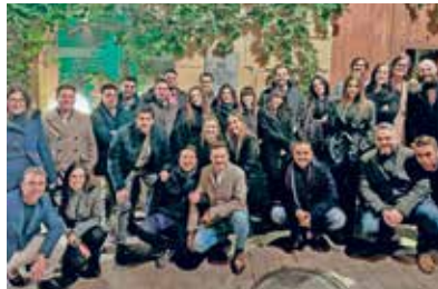
Assistents al sopar de Nadal del GAJT.

L'advocacia jove tarragonina es va reunir, com és tradició, en un sopar que se celebra pels volts de les festes de Nadal amb la voluntat d'acomiarar l'any en un ambient festiu. Aquesta edició, que va tenir lloc el dia 1 de desembre al restaurant Barhaus, va reunir a prop de quaranta persones, tot un èxit de participació! Esperem l'any vinent seguir poder compartint tants bons moments amb tots vosaltres.