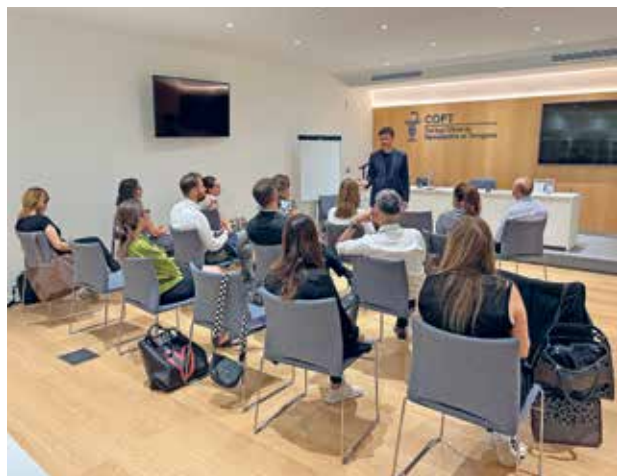
Participants a la sessió pràctica sobre habilitats comunicatives