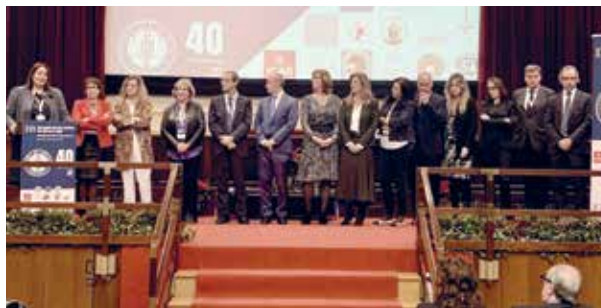
La degana de l'ICAT durant la lectura de la carta oberta als professionals del torn

En el marc de les Jornades de Juntes de Govern celebrades el dia 1 de desembre de 2023, el Consell de l'Advocacia Catalana va fer pública una carta oberta als més de 6.500 professionals que presten el servei del torn d'ofici en la que es detallava l'estat de les negociacions amb el Departament de Justícia per la millora de la justícia gratuïta. Aquest és el primer cop que els catorze col·legis de l'advocacia s'uneixen en una sola veu per reivindicar i defensar unes retribucions dignes per al torn d'ofici. Fins al moment, i tot i les més de trenta reunions mantingudes amb el Departament de Justícia i altres conselleries, les propostes plantejades resulten encara clarament insuficients i, per acord plenari del Consell de l'Advocacia Catalana, no s'han acceptat i així s'ha comunicat formalment. El principal dèficit de la proposta d'acord recentment proposat és que queda supeditada als pressupostos de la Generalitat de 2024, que al tancament d'aquesta edició de la revista encara estaven pendents de tramitació, i al sostre de despesa que li pertocarà al Departament de Justícia per l'any vinent, que actualment encara es desconeix.