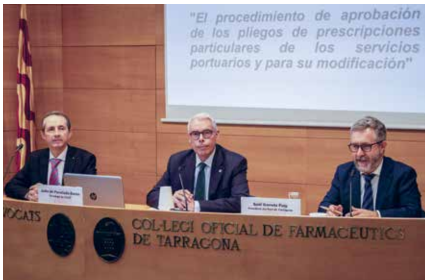
Taula d'inauguració de les jornades

La jornada, en format presencial i també en línia, va comptar amb 4 ponències i 4 espais col·loqui on es va tenir l'oportunitat d'intercanviar coneixements, reflexionar sobre els desafiaments i oportunitats que enfronta el sector portuari, i explorar noves tendències i innovacions.