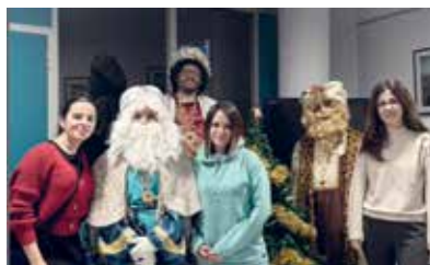
El GAJT amb els patges reials durant la festa infantil de l'ICAT

der continuar gaudint per molts anys més.