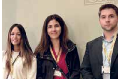
Representants del GAJ durant el Congrés de l'Advocacia Jove