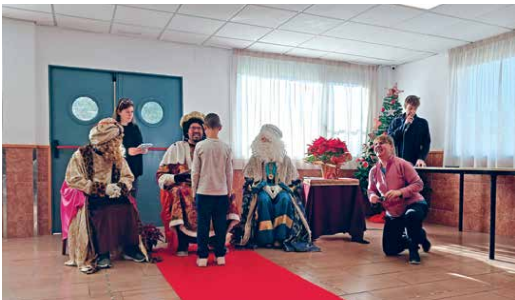
Els patges reials de l'ICAT fent entrega de regals

Des del Col·legi agraïm a la Muntanyeta l'oportunitat de poder contribuir en un acte tan especial i compartir amb tots els alumnes del centre la màgia d'aquestes festes. I també, i molt especialment, al Grup de l'Advocacia Jove que any rere any fa possible una diada tan bonica com aquesta.