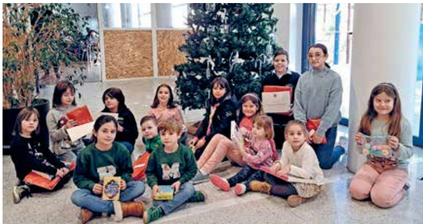
Fotografia dels nens i nenes que van participar al concurs de dibuix

L'acte d'entrega dels obsequis i diplomes es va celebrar el dia 21 de desembre amb la participació dels infants, de les famílies i dels membres de la Junta de Govern. Des de l'ICAT agraïm a totes les famílies i nens la seva participació i esperem que l'any vinent puguem dedicar una nova edició a dibuixar els millors desitjos per un Nadal amb companyia, alegria i sobretot, en pau.