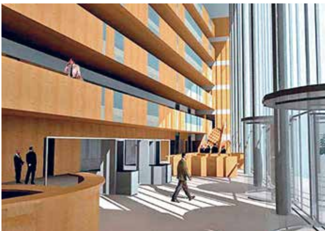
Imatge virtual del futur fòrum judicial de Tarragona.

l'informe de la Sindicatura de Greuges remarcarà “la urgència d'un equipament que ha de ser una prioritat per al Govern” i va recordar que tenen prevista una reunió amb el conseller de Justícia, Ramon Espadaler, per reiterar-li el caràcter urgent de l'esperat edifici.