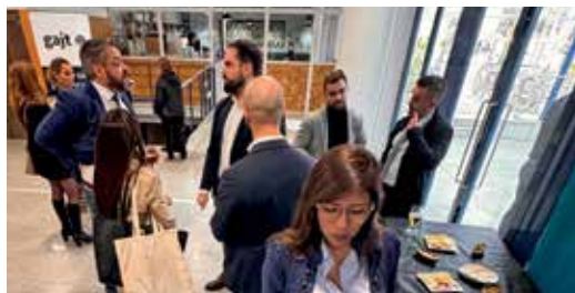
Participants a la diada de l'advocacia jove

També, i en motiu del Dia per a l'Eliminació de la Violència sobre la Dona, el GAJT va organitzar una taula divulgativa al Palau de Justícia de Tarragona on es va llegir el manifest de la diada.