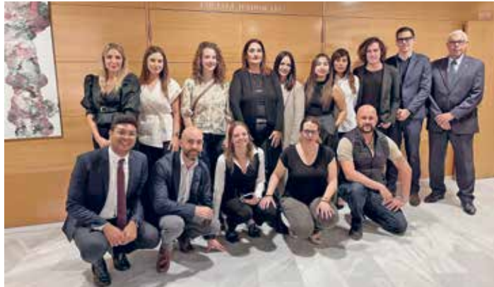
Assistents a l'acte de benvinguda del mes d'octubre

d'oferir una atenció més personalitzada per part dels màxims responsables de la institució per poder atendre els dubtes o suggeriments dels nous companys i companyes de professió. Finalitzada la reunió, es va realitzar una visita a les instal·lacions col·legials. Benvinguts i benvingudes a l'ICAT!