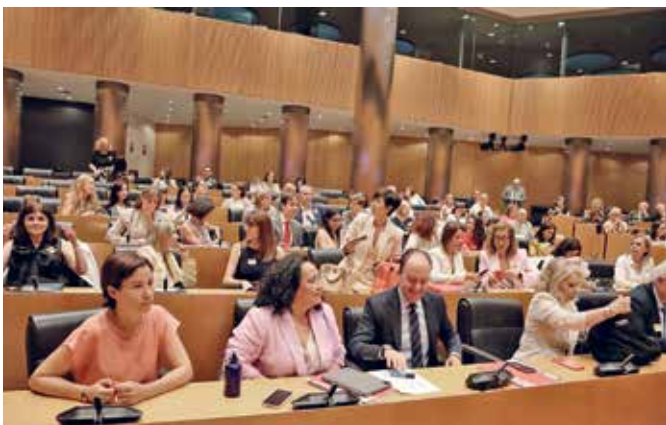
Assistents a la Jornada al Congrés dels Diputats

Lamentablemente los cambios no son suficientes y de nuevo, el legislador consciente o inconscientemente olvida en el ámbito de la justicia, a pilares fundamentales de la sociedad: la familia y la infancia.