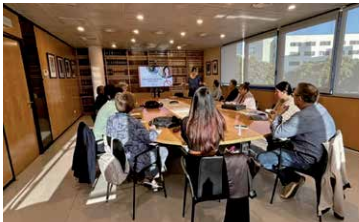
Assistents a la formació en IA jurídica a l'ICAT

Per donar-los a conèixer al col·lectiu, el passat mes d'octubre es va organitzar una sessió informativa amb dues de les bases de dades més conegudes en IA jurídica: la base de dades de GenIA-1 de El Derecho i la base de dades de Vincent AI, d'vLex. Durant la jornada els participants van poder fer les seves consultes i van poder contrastar el resultat en aquestes dues bases de dades i també en un xatbot genèric (ChatGPT). L'experiència va ser molt enriquidora i per al proper any 2025 des de l'àrea de formació es programaran diferents conferències i jornades per oferir més coneixement d'aquestes eines i de com poder-les aplicar en el nostre dia a dia.