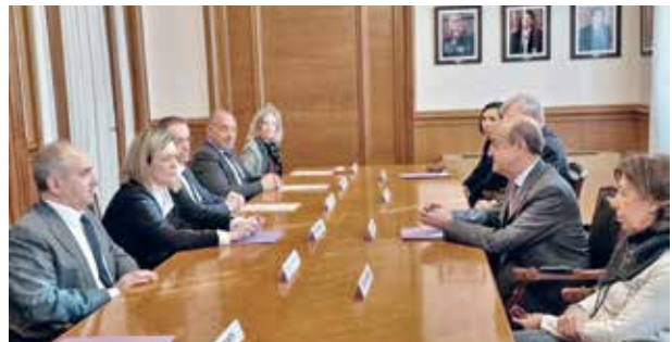
Signatura de l'acord per la Comissió Mixta al TSJC

Tant els tribunals com els professionals que intervenen en els processos judicials procuraran aplicar els presents criteris orientatius amb flexibilitat, per tal d'aconseguir disminuir el nombre de suspensions i minimitzar els trastorns que ocasionen.