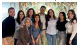
Dinar de germanor