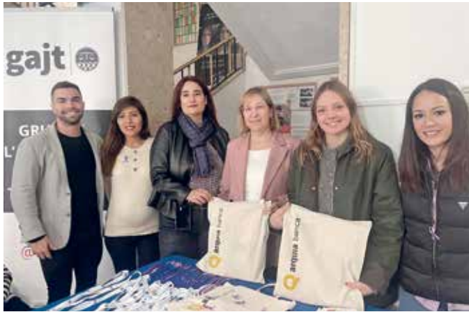
Acte del 25N al Palau de Justícia

formar dels serveis que existeixen actualment de suport i acompanyament a les víctimes. Al migdia, i com és tradició, membres de la Junta Govern i del GAJT van llegir el manifest de la jornada i que aquest any es va centrar en la visibilització de la violència masclista en l'espai públic i de reivindicació d'espais lliures i segurs.