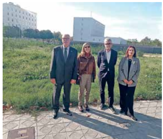
Visita del síndic al solar on s'ha de construir la futura Ciutat de la Justícia