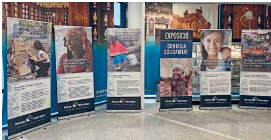
Exposició "Contagia solidaritat" al vestíbul de la seu de l'ICAT

Mentre hi hagi persones que no tinguin garantits els drets bàsics en els països del Sud, la cooperació internacional serà necessària. Mans Unides des de sempre ha treballat amb els països més pobres del món i hi continuarà treballant per aconseguir un món més sostenible on ningú es quedi enrera. Només l'any 2023 es va donar ajuda directa a més d'1.300.000 beneficiaris. Això ens encoratja a continuar treballant. El desenvolupament és una eina transformadora en la lluita contra les desigualtats i en favor de la justícia social. No hi ha dos móns, és un únic món desigual, on una part de la societat té accés a molts recursos i drets que no són accessibles a una altra part. És el nostre deure compartir i ser conscients d'aquesta realitat.