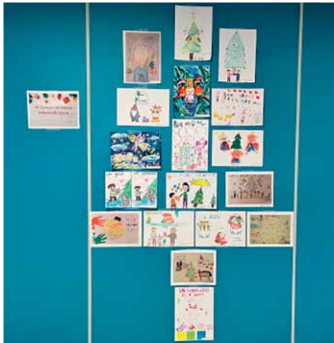
Arbre de Nadal amb els dibuixos del concurs infantil

Durant la diada també s'entregaran els premis als participants del Concurs de Dibuix Infantil, que aquest any compleix el seu quart aniversari. En aquesta edició, i encara trasbalsats per l'impacte de la DANA i les seves greus conseqüències, el lema que s'ha escollit és "Un gest, un somriure" per donar valor als petits gestos que són sovint els que més alegria i esperança poden portar a aquells que més ho necessiten. De tots els dibuixos rebuts, l'ICAT escollirà el que serà la felicitació institucional del Nadal. Tots els dibuixos participants s'exposen a la seu de l'ICAT fins passada la festivitat de Reis.