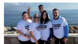
Cursa de running