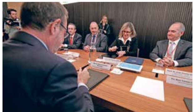
Signatura de l’acord entre el Departament de Justícia i Qualitat Democràtica i el Consell de l’Advocacia Catalana

Entre els punts més rellevants d’aquest acord, recordem, hi ha l’increment del 13,2% de la partida destinada als diferents mòduls, que suposa 8 milions d’euros addicionals. Això inclou un augment de les retribucions dels diferents mòduls en un percentatge que oscil·la entre el 2 i el 25,6%, així com la creació de nous mòduls i la introducció d’una compensació econòmica per la disponibilitat. També s’ha acordat un major reequilibri territorial en la prestació de les guàrdies i l’aplicació de nous criteris més objectius en determinats mòduls. Finalment, el Govern es compromet a incrementar aquestes xifres quan disposi de nous pressupostos. Des del Col·legi celebrem aquesta notícia i seguirem treballant per millorar les condicions en l’exercici dels professionals de l’advocacia que presten aquest servei.