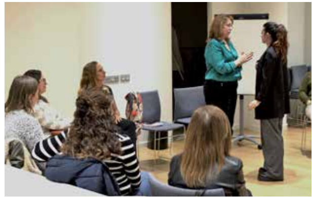
Participants durant la sessió pràctica sobre mediació sistèmica