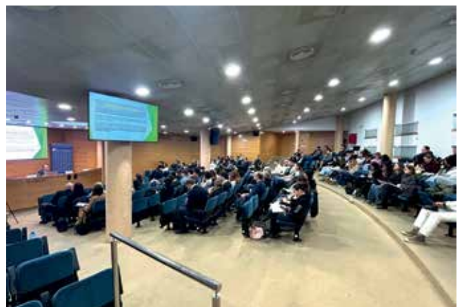
Assistents a les Jornades de Portuari a la sala d'actes de l'ICAT