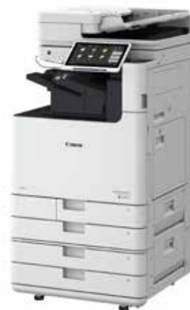
Serie imageRUNNER ADVANCE