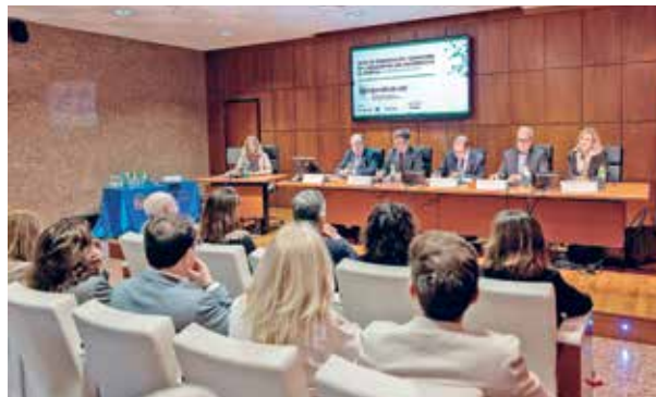
Acte d'adhesió de la Xarxa Vives al Compendium.cat

busca potenciar l'ús del català tant en la formació com en la pràctica jurídica. Recordem que amb l'objectiu de millorar el coneixement i l'ús del català en l'àmbit del dret, el portal Compendium.cat ofereix una àmplia gamma de recursos lingüístics per a estudiants, professors i professionals. Aquesta iniciativa, recolzada per la Generalitat de Catalunya, consolida el Compendium.cat com una eina estratègica per a la normalització lingüística en el sector jurídic.